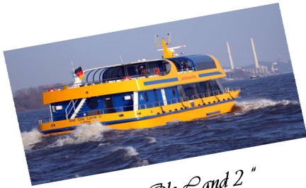
„Dat Ole Land 2“

Ob eine Hochzeit, eine Familienfeier, eine Betriebs- oder Vereinsfeier, eine Tagung, ein Kongress, ein maritimes oder exklusives Event, mit unserem "Erlebnisservice" an Bord werden wir Sie und Ihre Gäste kulinarisch verwöhnen und somit Ihren „Traum zum Erlebnis machen“!