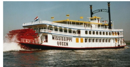
„Raddampfer Mississippi Queen“

Die „Ole Land 2“ (bis 100 Pers.), das „Elbtraumschiff Solar“ (bis 150 Pers.), das „Küstenmotorschiff Greundiek“ im Stader Hafen (bis 100 Pers.), der „Raddampfer Mississippi Queen“ (bis 400 Pers.), sowie das „Genießerschiff Schwingeflair“ (bis ca.50 Pers.) lassen für keine Feier Wünsche offen.